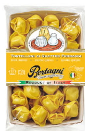
BTN10316 四種起司義大利餛飩 Four Cheeses Tortelloni

規格 250g(23~24顆)*6盒/箱 內餡 瑞可達起司、菠菜、帕達諾起司、帕米吉阿諾起司