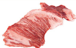
IBQ15222 伊比利豬松阪肉 需預訂 Iberian Skirt Steak "SECRETO" 規格 約350g/包