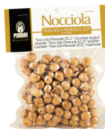
PRA11603 150g*24包/箱 PRA11604 1kg*10包/箱 皮蒙特烤榛果(去皮) IGP Piemonte Hazelnut Roasted