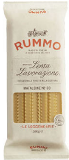
RMO10325 No.80 波浪麵 Mafaldine 規格 500g*12包/箱