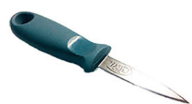
TOL17202 塑膠柄生蠔刀 Plastic Oyster knife