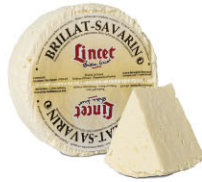
CHF16328 需預訂 布瑞薩瓦林 Brillat Savarin 規格 500g*3/箱