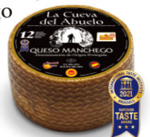
CHS16442 曼切格起司(12個月熟成) Manchego 規格 ±3kg