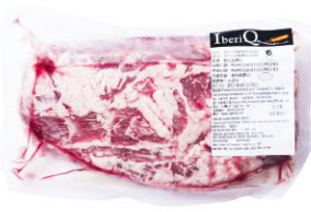
伊比利豬梅花肩肉 Iberian Collar IBQ15250 Cebo IBQ15254 Bellota 規格 約2kg/包