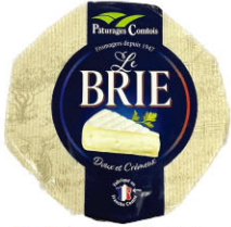
CHF16323 500g*6/箱 CHF16320 1kg*4/箱 布利 Brie