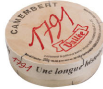
CHF16321 卡門貝爾(木) 需預訂 Camembert Vallee 規格 250g*12/箱