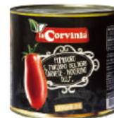
MLN01432 聖馬札諾番茄粒 San Marzano Tomato DOP 規格 2.5kg*6罐/箱