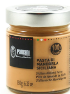
PRA11522 180g*12罐/箱 PRA11521 1kg*6罐/箱 100%西西里杏仁醬 Sicilian Almond Paste