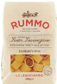
RMO10317 No.141 花枝圈型麵 Calamarata 規格 500g*12包/箱