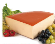
CHH16212 風頭起司 需預訂 Fontal 規格 ±3kg