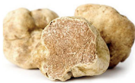
FTF01221 義大利白松露 Italian White Truffle FTF01222 阿爾巴認證白松露 Certified Italian White Truffle of Alba