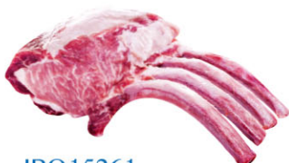
IBQ15261 伊比利豬戰斧(4根骨) Iberian Tomahawk 規格 約1kg/包 需預訂