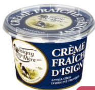
CHF16101 需預訂 法式酸奶油 Crème Fraîche 規格 500g*6/箱