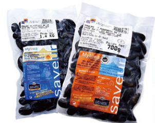
SEA07153 700g*8包/箱 SEA07151 1.4kg*8包/箱 法國聖米歇爾山活淡菜AOC French Live Bouchot Mussel from Mount St. Michel 季節限定8月-12月