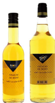
MDL09112 500ml*6瓶/箱 MDL09111 1L*6瓶/箱 香檳醋 Champagne Vinegar