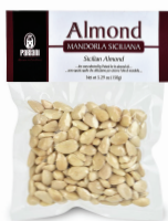
PRA11622 西西里生杏仁果(去皮) Sicilian Almond Raw Peeled 規格 150g*24包