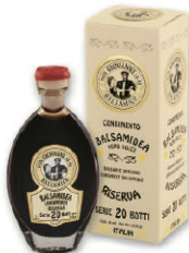
DGV09216 20年巴薩米克醋 IGP 20 Year Balsamic di Modena IGP 規格 40ml*6瓶/箱