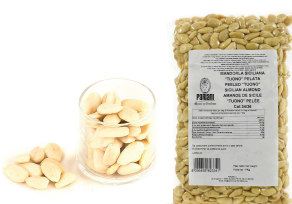
PRA11621 西西里生杏仁果(去皮) Sicilian Almond Raw Peeled 規格 1kg