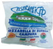
CHF16254 水牛莫札瑞拉 需預訂 Buffalo Mozzarella 規格 150g*10/箱