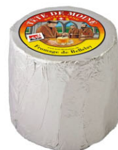
CHH16502 僧侶頭 需預訂 Tete de Moine 規格 ±900g 30372 僧侶頭乾酪(黑) Tete de Moine Extra 規格 ±900g*4個/箱 需成箱預訂