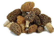
VGf03 121 羊肚蕈 Morel 規格 1kg 產季 4月~5月