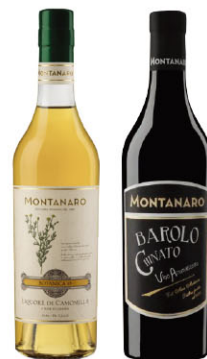
MTR13407 洋甘菊義式利口酒 Liquore di Camomilla 規格 500ml*6瓶/箱

經過兩年木桶陳年保持其雄厚力道，將其過於銳利的酒精感消除後，僅留下香醇複雜的Nebbiolo香味，是精品級代表作！ 規格 700ml*6瓶/箱