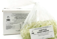
PRA11696 糖漬香水檸檬皮丁 Candied Citron In Cubes 規格 1kg