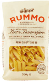
RMO10307 No.66 尖管麵 Penne Rigate 規格 500g*16包/箱