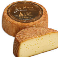
29528 需預訂 侏羅紀系列核桃 利口酒風味起司 La Noix Jurassic 規格 ± 800g*2/箱