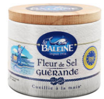
SLN12128 葛宏德鹽之花 Guérande Fleur De Sel 規格 125g*12罐/箱