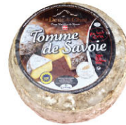
CHF16311 需預訂 湯德薩瓦 Tomme De Savoie 規格 ±1.7kg*3個/箱