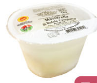
CHF16256 需成箱預訂 迷你水牛起司 Mini Buffalo Mozzarella 規格 200g(20g*10)*6盒/箱