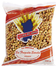
LCG10302 珍珠米型麵 Fregola Sarda 規格 500g*12包/箱

1950年創立於義大利西南方的薩丁尼亞島，有著得天獨厚的氣候條件，延續著幾世紀以來的古老食譜與製作工法，100%杜蘭小麥粉製成，並嚴格控管小麥粉品質，成為島上數一數二的傳統麵型製造商。