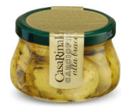
ALS01701 油漬炭烤朝鮮薊 Grilled Artichokes 規格 320g*12罐/箱