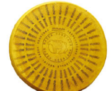
31180 紅牛帕米吉 阿諾起司 36月 Parmigiano Reggiano Vacche Rosse 規格 ± 40kg/箱(可分切)