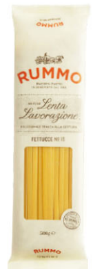
RMO10324 No.15 中寬扁麵 Fettucce 規格 500g*24包/箱