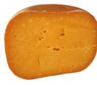
CHS16301 米莫雷特 需預訂 Mimolette Cheese 規格 ±3kg/±3.5kg