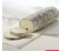
CHF16341 需預訂 黑皮聖莫瑞羊起司 St. Maure De Touraine 規格 200g*6/箱