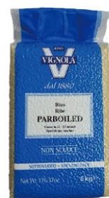
VNL10121 預煮米(蒸穀米) Baldo Parboiled Rice 規格 5kg*2包/箱(真空包裝)