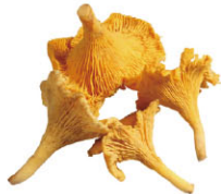
VGf03 131 迷你3kg/箱 VGf03 132 普通1kg/箱 雞油菇(黃菇) Girolles 產季 6月~12月