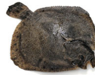
SEA07104 比目魚(大菱魷) Turbot 箱裝 ±10kg/箱 產地 法國野生/西班牙養殖 規格 1-6kg/隻，請洽詢