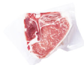
伊比利豬丁骨豬排 Iberian Chop With Tenderloin IBQ15204 Cebo IBQ15214 Bellota 規格 約300g/包