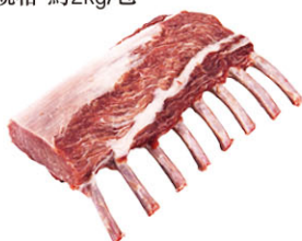
伊比利豬法式帶骨里肌肉 Iberian Pork Rack IBQ15263 Cebo IBQ15268 Bellota 規格 1~2kg/包