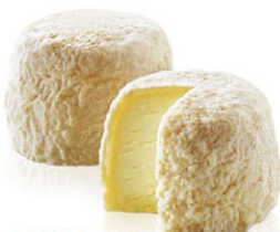
CHF16342 可洛亭羊奶起司 需預訂 Chevre Crottin 規格 60g*12/箱