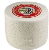
28586 需預訂 佩克里諾羅馬 綿羊起司 Pecorino Romano DOP 規格 ± 6.25kg/箱(1/4顆)