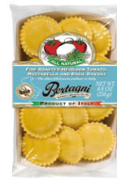
BTN10312 番茄起司羅勒義大利餃 Tomato Mozzarella Basil Ravioli

規格 250g(48~50顆)*6盒/箱 內餡 瑞可達起司、帕達諾起司、莫札瑞拉起司、帕米吉阿諾起司、馬鈴薯