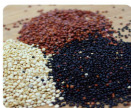
GDN10201 白色 White GDN10202 黑色 Black GDN10203 紅色 Red 秘魯藜麥 Quinoas from Peru 規格 1kg*25包/袋