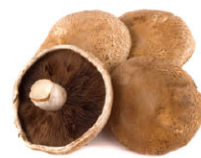
VGL03 101 全年供應 波特菇(龍葵蕈) Portobello 規格 500g*6/箱