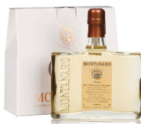
MTR13404 煉金術士義式白蘭地 Grappa Alchimista 規格 500ml*6盒/箱

MTR13408 巴羅洛義式消化酒 Barolo Chinato 規格 750ml*6瓶/箱