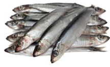
SEA07106 沙丁魚 Sardine 箱裝 ±4kg/箱(約14隻) 產地 歐洲 規格 13-15隻/kg