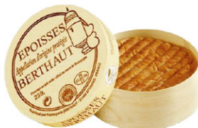
CHH16312 艾波洗 需預訂 Epoisse 規格 250g*6/箱