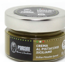
PRA11514 開心果抹醬 Pistachio Spread 規格 100g