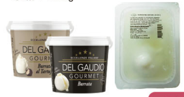
CHF15258 需預訂 原味250g(125g*2)*8盒/箱 CHF15256 原味100g*14/箱 CHF15257 松露風味100g*14/箱 新鮮布拉塔 Burrata