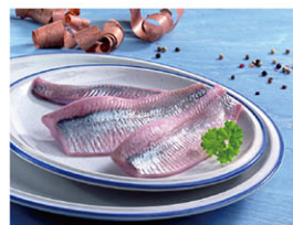
GRH07301 海令魚片(小鯡魚菲力) Matjes Herring 箱裝 400g*15盒/箱 產地 荷蘭 規格 每盒400g約5片