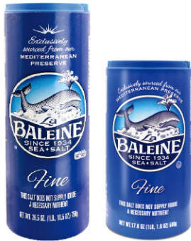
SLN12101 550g x12罐/箱 SLN12104 750g x12罐/箱 細海鹽(無含碘) Fine Sea Salt