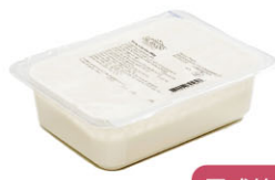
CHF16251 需成箱預訂 新鮮絲網乳酪 Straciatella 規格 250g*8盒/箱