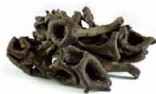
VGf03 141 黑喇叭菇 Black Trumpet 規格 1kg 產季 9月~12月