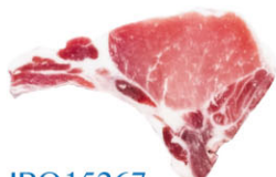
IBQ15267 伊比利豬帶骨豬排 Iberian Chop With Ribs 規格 約300g/包 需預訂