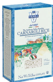
VNL10111 卡納羅利義大利米 Carnaroli Risotto 規格 1kg*10盒/箱(真空包裝)