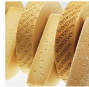
CHH16202 蒙他西歐 需預訂 Montasio 規格 ±6kg