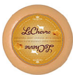
CHS16507 蜂蜜羊奶起司 Goat Cheese With Honey 規格 4kg