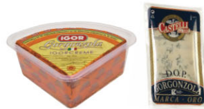
CHF16233 ±1.5kg(1/4塊) CHH16231 170g*12/箱 古根左拉 需預訂 Gorgonzola