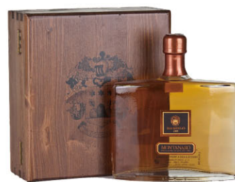
單一年份巴羅洛義式白蘭地 木裝禮盒 Grappa di Barolo Millesimata 規格 500ml*6盒/箱