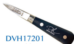
DVH17201 大衛赫夫 黑色生蠔刀 Oyster Knife