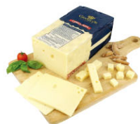
CHS16511 艾曼塔 Emmentaler 規格 ±3kg