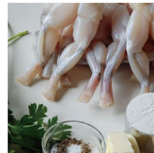
SEA07113 蛙腿(去皮) Frog Legs 箱裝 3kg/箱 產地 法國 規格 200隻/箱