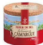
SLN12121 卡馬格鹽之花 Camargue Fleur De Sel 規格 125g*12罐/箱