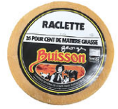
CHF16314 需預訂 洛克雷 Raclette 規格 ±6kg