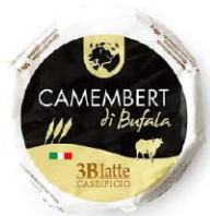
30110 需預訂 水牛乳 卡門貝爾起司 Camembert di bufala 規格 150g*6/箱