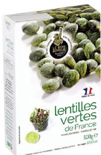
LBS04101 法國綠扁豆 French Green Lentil 規格 500g*10盒/箱