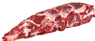
伊比利豬肋眼蓋肉 Iberian Loin End "PLUMA" IBQ15232 Cebo IBQ15231 Bellota 規格 約200~350g/包