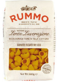
RMO10319 N.169 蝸牛殼麵 Gomiti Rigati 規格 500g*16包/箱