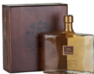
MTR13406 巴羅洛義式白蘭地 卡努比莊園木裝禮盒 Grappa di Barolo Cannubi 規格 500ml*6盒/箱