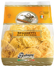
BTN10301 鳥巢細新鮮蛋麵 Spaghetti alla Chitarra

義大利最老的麵餃(Tortelloni)製造商，烹煮簡單，全天然無防腐劑、無香料，麵皮含30%非籠飼雞蛋(Cage Free Egg)，嚴選食材，用心調配餡料，料多味美，傳統工法製麵不摻水，如義大利老媽媽親手做的麵餃與家常麵，麵體飽滿溫暖。