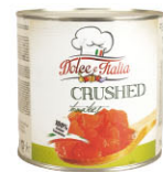
OTH01402 番茄碎 Crushed Tomato 規格 2.5kg*6罐/箱