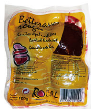
GRH01401 熟甜菜根 Cooked Beetroot 規格 500g*18包/箱