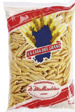
LCG10304 細長型麵疙瘩 Gnocchetti Sardi Lunghi 規格 500g*20包/箱