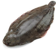
SEA07105 多佛蝶魚 Dover Sole 箱裝 ±6kg/箱 產地 法國 規格眾多，請洽詢