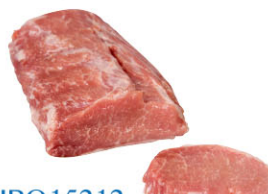
IBQ15212 伊比利豬帶脂大里肌肉 Iberian Loin With Fat 規格 約1kg/包 需預訂