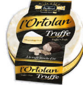
24418 需預訂 黑松露調味 奧托蘭起司 Ortolan Truffle 規格 135g*6/箱