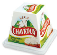
CHH16341 羊起司 需預訂 Chavroux Pure Goat 規格 150g*12個/箱