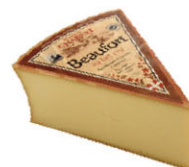
CHF16304 布佛 需預訂 Beaufort 規格 ±5kg