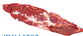
IBQ15202 伊比利豬小里肌肉 Iberian Tenderloin 規格 約300g/包 需預訂