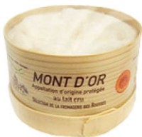
CHF16336 金山AOP Mont D'or AOP 規格 500g*12/箱 冬季限定 需預訂