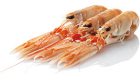
SGL07305 10~15隻/包 SGL07302 7~9隻/包 SGL07304 4~7隻/包 長腳蝦 Langoustine Scampi 規格 3kg/箱 產地 愛爾蘭 規格眾多，請洽詢