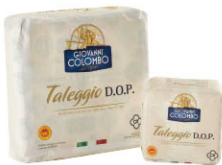
CHF16211 塔雷吉歐 需預訂 Taleggio 規格 ±2kg