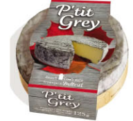
21657 需預訂 小灰皮軟質起司 P'tit Grey 規格 125g*6/箱