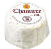
CHF16338 夏梧斯 需預訂 Chaource 規格 250g*6/箱