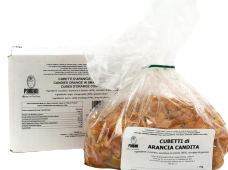
PRA11695 糖漬柳橙皮丁 Candied Orange In Cubes 規格 1kg