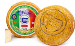
20206 需預訂 皮蒙特產區托馬 Toma piemontese DOP 規格 ± 2kg/箱