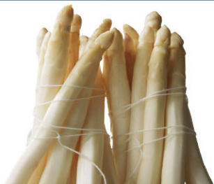
VGF01260 22+ VGF01261 32+ 法國白蘆筍 French White Asparagus 規格 ±5kg/箱 產季 3月~6月