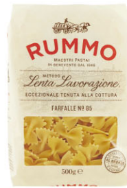
RMO10315 No.85 蝴蝶麵 Farfalle 規格 500g*16包/箱