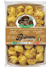
BTN10311 牛肝草義大利餛飩 Porcini Mushroom Tortelloni