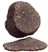
FTF01231 Winter 冬季 澳洲冬季黑松露 Australian Black Truffle