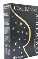
ALS10201 北非米(庫司庫司) Couscous 規格 500g*12包/箱