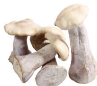
VGf03 151 全年供應 藍腳菇 Pied Bleu (Blue foot) 規格 1kg