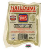
CHF16951 哈魯米 需預訂 Halloumi 規格 250g*40包/箱