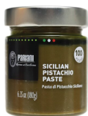
PRA11511 180g*12罐/箱 PRA11512 1kg*6罐/箱 100%西西里開心果醬 Sicilian Pistachio Paste