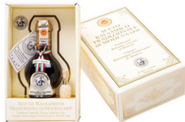
DGV09217 摩典那傳統25年巴薩米克醋 Aceto Balsamico Tradizionale di Modena DOP 規格 100ml*2盒/箱