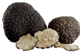
FTF01211 Summer 夏季 FTF01212 Autumn 秋季 FTF01213 Winter 冬季 義大利黑松露 Italian Black Truffle