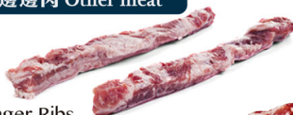
IBQ15292 豬肋條 Iberian Finger Ribs IBQ15291 迷你豬肋條 需預訂 Iberian Pork Mini Finger Ribs 規格 約750g-1kg/包