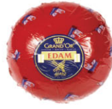
CHS16512 伊登 Edam 規格 ±2kg*6個/箱