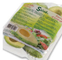
SLD05301 去皮剖半酪梨 Peeled Avocado Halves 規格 500g*12包/箱