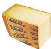
CHS16502 葛瑞爾 Gruyere 規格 ±3kg