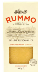
RMO10311 No.173 含蛋千層麵皮 Lasagne All'uovo (with egg) 規格 500g*12包/箱