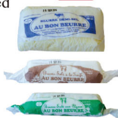
CHF16121 需預訂 半鹽 Half-Salted 規格 125g*40/箱 CHF16122 松露 Truffle 規格 125g*16/箱 CHF16123 海藻 Seaweed 規格 125g*16/箱