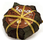
CHH16343 巴農 冬季限定 需預訂 Banon 規格 100g*8個/箱