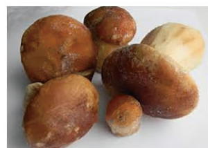
GRF03302 冷凍牛肝蕈(大) Extra Frozen Cepe 規格 1kg*5包/箱