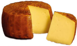
CHS16241 佩克里諾 Pecorino Barbagia 規格 ±1kg*8個/箱