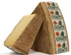
康德 Comte CHF16301 6個月熟成 需預訂 CHF16305 30個月陳年 需預訂 CHF16302 36個月陳年 需預訂 規格 ±3kg 分切