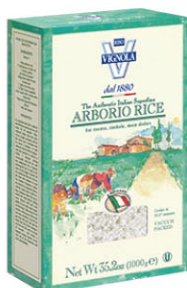
VNL10101 阿伯瑞歐義大利米 Arborio Risotto 規格 1kg*10盒/箱(真空包裝)

義大利第一個使用紙盒精裝稻米的品牌，也是真空技術包裝稻米的先驅。這個1880年創立的百年家族企業，為全球的稻米產業帶來革命性的改變，並持續生產高品質稻米。如今他們的產品已攻佔了全球數百萬人的餐桌。