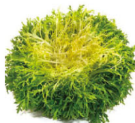
VGF01201 黃捲鬚 Frisee Yellow 規格 ±3kg/箱