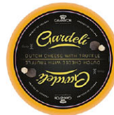
CHS16506 松露風味起司 Dutch Cheese With Truffle 規格 ±4.5kg