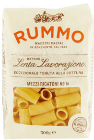
RMO10306 No.51 短管麵 Mezzi Rigatoni 規格 500g*16包/箱