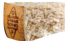
CHS16261 帕達諾起司絲 DOP 需預訂 Shredded Grana Padano DOP 規格 1kg