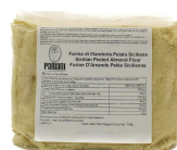
PRA11901 西西里杏仁粉 Sicilian Almond Flour 規格 1kg*10包