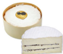
21036 需預訂 松露風味 三倍乳脂起司 (雙層內餡) Double Truffle Argental 規格 1kg/箱