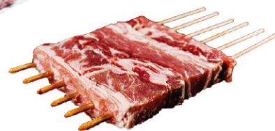
伊比利豬腹脇肉串 需預訂 Iberian Pork Skewer IBQ15296 透明真空袋 160g~200g IBQ15290 牛皮真空定規包 170g