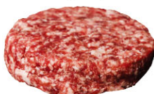
伊比利豬漢堡排 需預訂 Iberian Pork Burgers 規格 200g/包