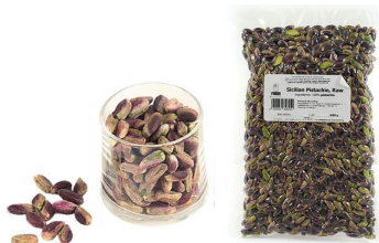
PRA11611 西西里生開心果(帶皮) Sicilian Pistachio Raw 規格 1kg