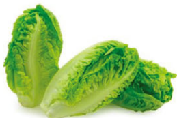
VGF01171 迷你蘿蔓 Baby Gem 規格 ±5kg/箱