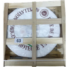
CHF16326 布利之王 需預訂 Brie De Meaux 規格 ±3kg