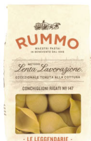
RMO10314 No.147 大貝殼麵 Conchiglioni Rigati 規格 500g*12包/箱