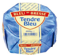
703120 需預訂 軟質藍起司 Tendre bleu 規格 400g*8/箱