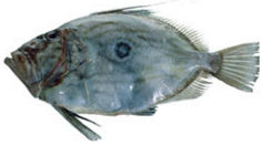
SEA07112 聖彼得魚(印章魚) St. Peter fish (John Dory) 箱裝 ±6kg/箱 產地 法國/台灣 規格 2-3kg/隻