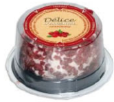
703653 需預訂 蔓越莓調味 爹里司起司 Mini Delice Cranberry Argental 規格 110g*6/箱