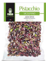
PRA11614 西西里生開心果(帶皮) Sicilian Pistachio Raw 100g 規格 100g*24包/箱