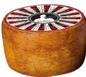
31008 需預訂 阿爾卑斯之花 職人嚴選 Fleur des Alpes 9M Grossrieder 規格 約4kg/箱