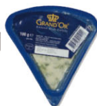
CHS16931 丹麥藍 Danish Blue 規格 100g*10個/箱