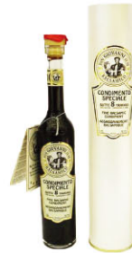
DGV09221 8年巴薩米克醋 8 Year Balsamic di Modena 規格 100ml*6瓶/箱