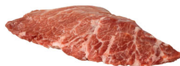
IBQ15242 伊比利豬肩胛肉 需預訂 Iberian Flat Iron "PRESA" 規格 約600g/包