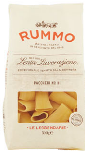
RMO10313 No.111 帕克里大管麵 Paccheri 規格 500g*12包/箱