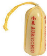
CHH16213 普羅諾尼 需預訂 Provolone 規格 ±1kg*12條/箱