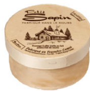
4117 需預訂 小金山軟質起司 Petit Sapin 規格 250g*6/箱