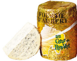
CHF16334 昂貝爾藍起司 需預訂 Fourme D'Ambert 規格 ±2kg 需預訂