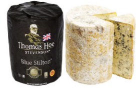
CHH16731 需預訂 史帝爾敦藍起司 Blue Stilton Cheese 規格 ±2kg