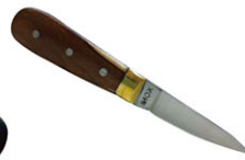
TOL17201 木柄生蠔刀 Wooden Oyster knife