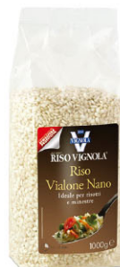
VNL10141 維亞羅內米 Vialone Nano Risotto 規格 1kg*10包/箱 (氣調式包裝)