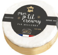
24419 需預訂 蒙特起司 Mon p'tit Creamy 規格 125g*6/箱