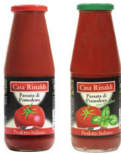
ALS12501 原味番茄糊 Tomato Passata ALS12506 羅勒番茄糊 Tomato Passata with Basil 規格 690g*12罐/箱