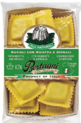
BTN10313 瑞可達菠菜義大利餃 Ricotta Spinach Ravioli

規格 250g(23~24顆)*6盒/箱 內餡 瑞可達起司、菠菜、帕達諾起司、帕米吉阿諾起司