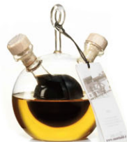
ALS17302 雙口油醋瓶 Olive Oil & Balsamic 規格 300ml*6瓶/箱