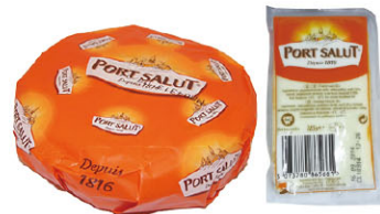
CHH16311 185g*8個/箱 CHF16340 2kg 波特莎露 需預訂 Port Salut