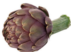
VGF01231 小朝鮮薊 Baby Artichoke 規格 ±5kg/箱