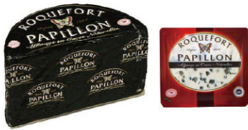
CHF16331 100g*12/箱 CHF16332 ±1.35kg*4個/箱 洛克福藍起司 需預訂 Roquefort Papillon