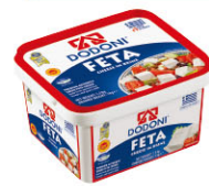
CHS16651 200g*16/箱 CHS16652 1kg*6/箱 飛達起司 Feta