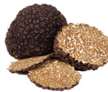
FTF01201 Summer 夏季 FTF01203 Autumn 秋季 FTF01202 Winter 冬季 法國黑松露 French Black Truffle