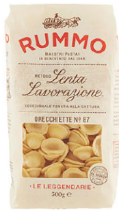
RMO10316 No.87 貓耳朵麵 Orecchiette 規格 500g*12包/箱