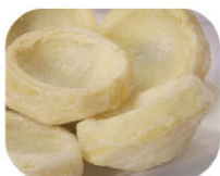
GRF01301 朝鮮薊底 Artichoke Buttom 規格1kg*5包/箱