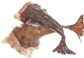
SEA07101 安康魚(去頭) Monkfish w/o Head 箱裝 ±6kg/箱 規格 2-4kg/隻，請洽詢