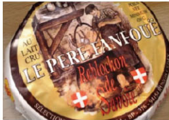
CHF16313 侯布雄薩瓦 需預訂 Reblochon De Savoie 規格 450g*12/箱