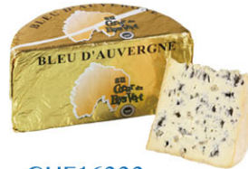
CHF16333 奧維涅藍起司 需預訂 Bleu D'Auvergne 規格 1.35kg*4/箱