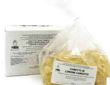
PRA11698 糖漬檸檬皮丁 Candied Lemon In Cubes 規格 1kg