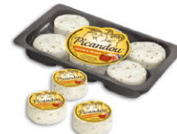
28835 需預訂 無花果蜂蜜 皮坎度山羊起司 Picandou miel figue 規格 (35g*6)*2/箱 (每盤6顆)