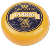
CHS 16501 ±4kg CHH16501 ±1kg 陳年 高達 Gouda