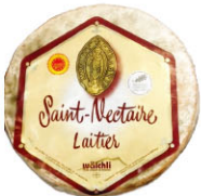
CHF16312 聖內克特 需預訂 St. Nectaire 規格 ±1.5kg