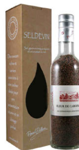
SAL12124 黑皮諾紅酒 Pinot SAL12123 卡本內蘇維翁紅酒 Cabernet 紅酒鹽之花 Fleur De Red wine 規格 350g*12瓶/箱