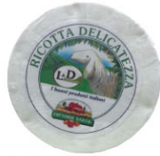
CHF16241 羊奶瑞可達 需預訂 Ricotta Delicatezza 規格 ±3.5kg