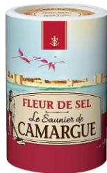
SLN12122 卡馬格鹽之花 Camargue Fleur De Sel 規格 1kg*6罐/箱