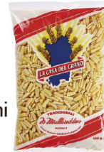
LCG10303 短型麵疙瘩 Gnocchetti Sardi Piccoli 規格 500g*20包/箱