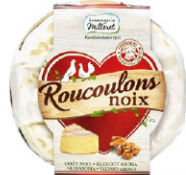
21580 需預訂 核桃風味 軟質起司 Roucouillons Noix 規格 125g*6/箱