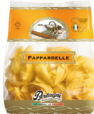
BTN10304 鳥巢大寬新鮮蛋麵 Pappardelle