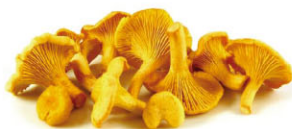
TLG03301 冷凍雞油蕈(黃菇) Frozen Girolles (Chanterelle) 規格1kg*5包/箱