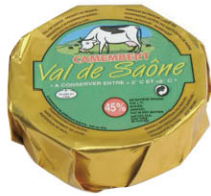
CHF16322 卡門貝爾(金) Camembert 規格 240g*12/箱