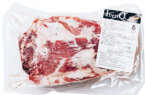
伊比利豬梅花肉 Iberian Collar without Flat "IRON" IBQ15253 Cebo IBQ15251 Bellota 規格 約1kg/包