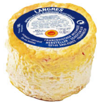
CHF16319 朗格 AOC 需預訂 Langres AOC 規格 180g*10/箱