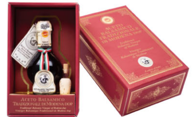
DGV09214 摩典那傳統12年巴薩米克醋 Aceto Balsamico Tradizionale di Modena DOP 規格 100ml*2盒/箱