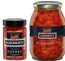
AGM01712 200g*12罐/箱 AGM01713 1kg*6罐/箱 油漬烘乾櫻桃番茄 Semi Dried Cherry Tomato In Sunflower Oil