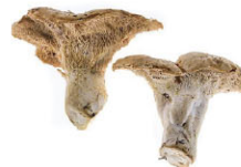
羊腳菇 Pied de Mouton (Sheep foot) 規格 1kg 產季 10月~隔年1月