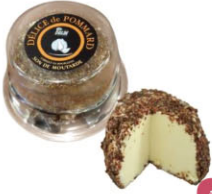
702339 需預訂 芥末味爹里司起司 Delice Pommard Coque 規格 100g*6/箱