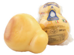
CHH16211 史卡摩拉 需預訂 Scamorza 規格 ±250g