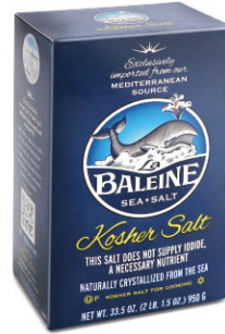
SLN12151 猶太鹽 (無含碘) Kosher Sea Salt 規格 950g*9/箱