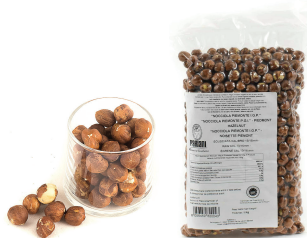
PRA11602 皮蒙特生榛果(帶皮) IGP Piemonte Hazelnut Raw 規格 1kg