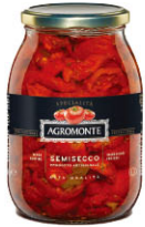
AGM01701 油漬烘乾番茄 Semi Dried Tomato in Sunflower Oil 規格 1kg*6罐/箱