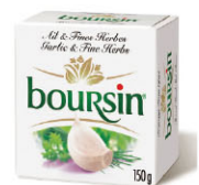
CHF16361 布爾辛大蒜 需成箱預定 Boursin, Garlic & Fine Herb 規格 150g*12/箱