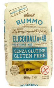
RMO10361 No.49 無麩質橫紋水管麵 Gluten Free Elicoidali 規格 400g*12包/箱