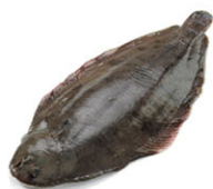
SEA07305 多佛蝶魚 Dover Sole 箱裝 10kg/箱 產地 法國 規格 約1kg/隻