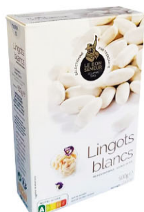
LBS04103 白腰豆 White Kidney Beans 規格 500g*10盒/箱