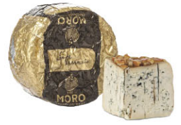
24114 需預訂 費歐氣泡酒 浸漬藍起司 Fior d'arancio 規格 ± 2.5kg/箱