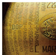
CHS16204 CHS16210 陳年 帕米吉阿諾 Parmigiano Reggiano 規格 約1-2kg/塊；約38kg/顆