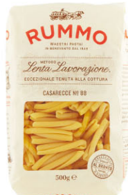
RMO10308 No.88 S形螺旋麵 Casarecce 規格 500g*16包/箱