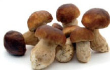
VGf03 111 牛肝蕈 Porcini (cepe) 規格 1kg 產季 9月~10月