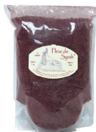
SAL12121 希哈紅酒鹽之花 Fleur De "Syrah" 規格 1kg/包