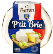
21718 需預訂 迷你布利起司 P'tit Brie 規格 125g*6/箱