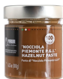
PRA11501 180g PRA11502 1kg 100%皮蒙特榛果醬 IGP Piemonte Hazelnut Paste