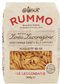
RMO10318 No.155 短型螺旋麵 Fusillotti 規格 500g*12包/箱